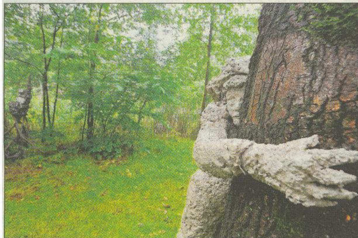
'Harmonie tegenstrijdigheid', door Ruth van de Pol.