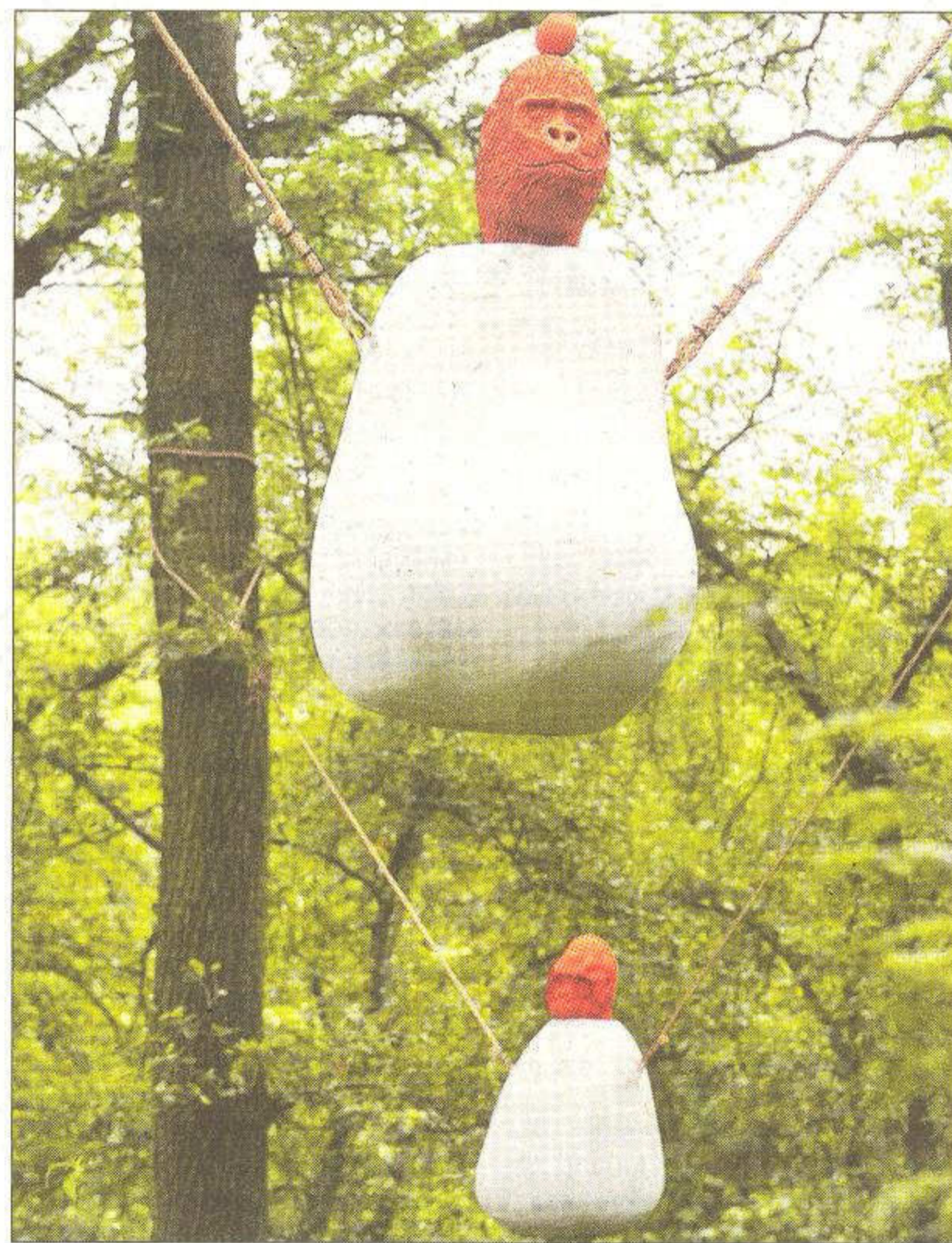
'Uit het paradijs gedreven', door Maarten Fleuren.

Ook zijn er ongewone objecten te zien op en langs het water van de Reusel, zoals de fietspompen in 'Water & Lucht' van Miranda Poel, waarmee de bezoeker zelf